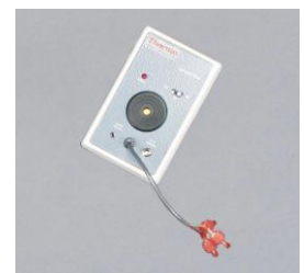
ローレベルアラーム